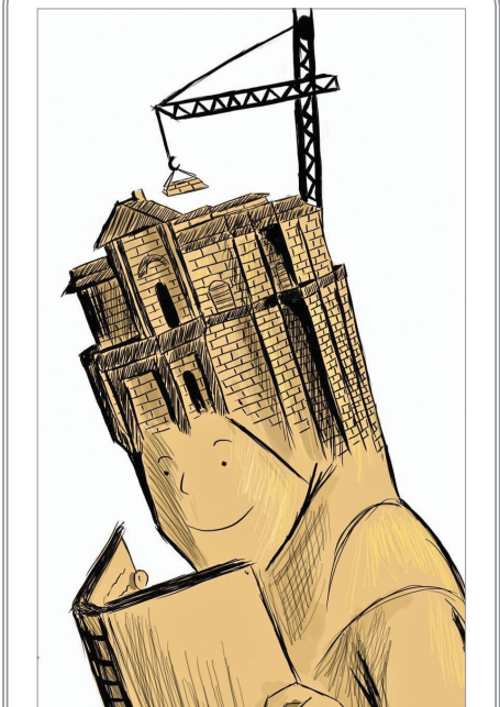
بخوان و بساز صفا عوده/ فلسطین