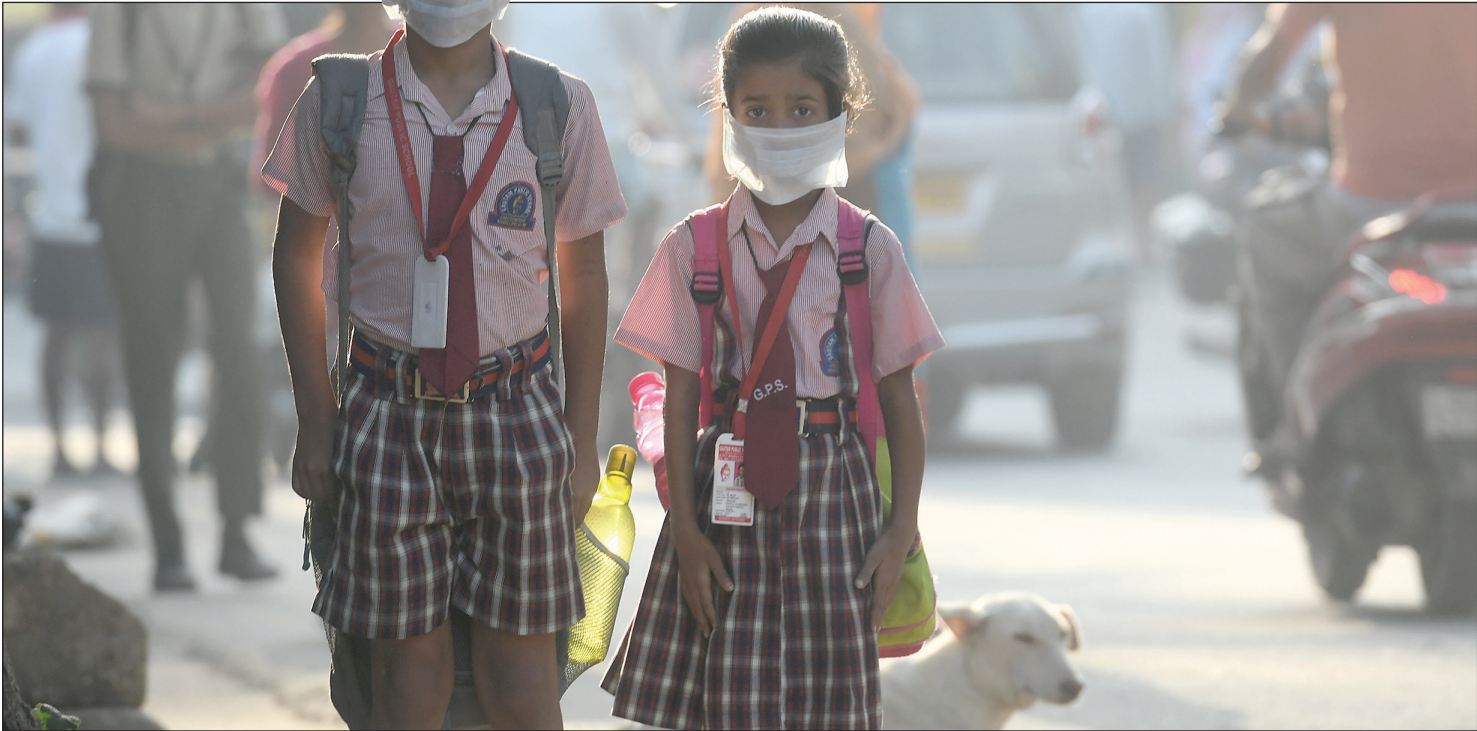
آلودگی هوا در دهلی نو