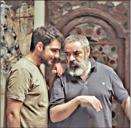
محمد از فیلم «شماره»