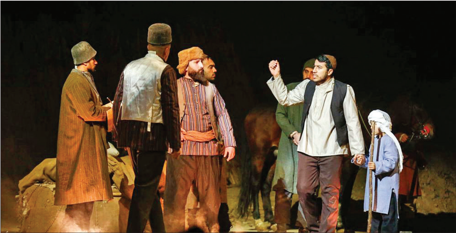
نمایش میدانی «جان فدا» در تهران