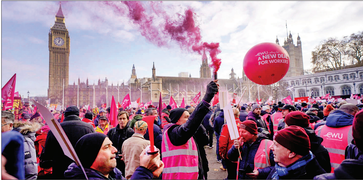
تظاهرات کارکنان پست در لندن