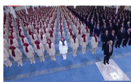
نماز جماعت مجاهدین در اشرف ۳ با حضور مریم رحوی