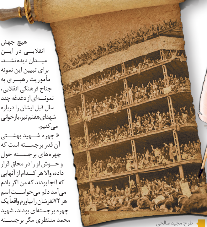
طرح: مجید صالحی

هیچ جهش انقلابی در ایسن میدان دیده‌نشند.