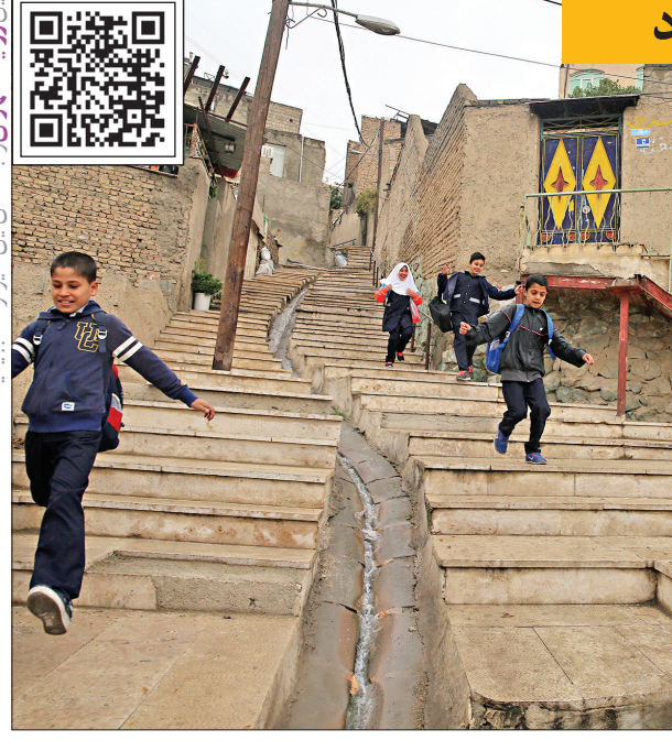
این روایت تهران را با اسکن این کیو آر کد ببینید.