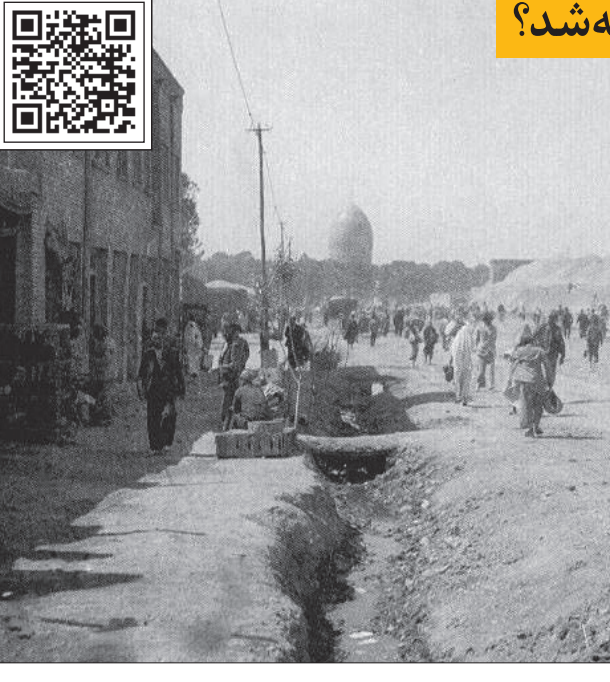
این روایت تهران را با اسکن این کیو آر کد ببینید.