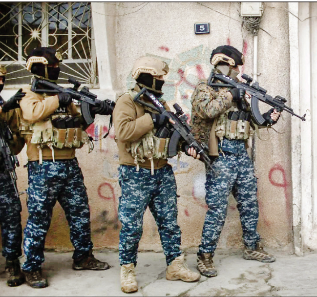
عملیات ضد داعش در استان حسکه در شمال سوریه به کمک نیروهای ناتو

نیروهای امنیتی همچنین گفته‌اند که اعضای داعش در زندان سلیمانیه، طرح «ولایت سلیمانیه داعش» را برنامه‌ریزی کرده بودند. با این حال به‌نظر می‌رسد که این اقدامات ضد تروریستی نتوانسته روند رو به رشد قدرت‌گیری دوباره داعش را متوقف کند. مجله اسپکتاتور نوشته: «موارد اخلاقی، مالیات و ارباب هدفمند داعش در عراق و سوریه بیشتر شده و استفاده این گروه از بمب‌گذاران انتحاری و استقرار خودروهای بمب‌گذاری شده افزایش یافته است. کارشناسان مبارزه با تروریسم، این اقدامات را نشانه خیزش گام به گام داعشی می‌دانند. این گروه تروریستی در حال تغییر رویکرد خود از عملیات‌های دفاعی به تهاجمی است.»