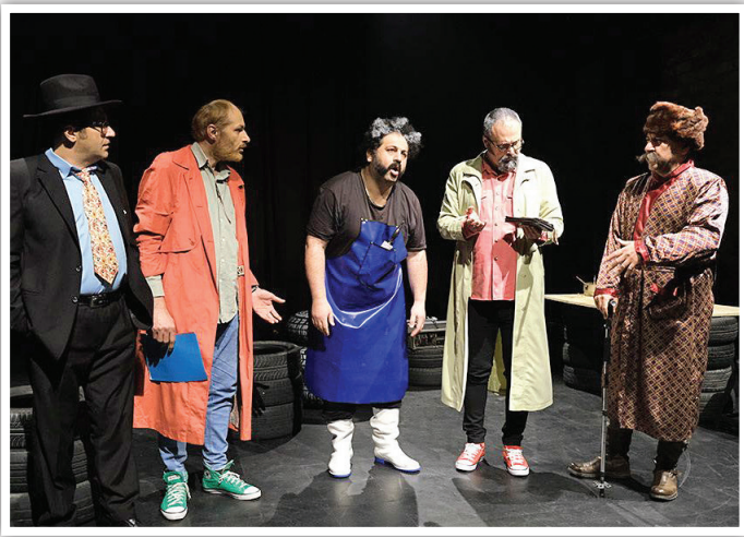
نمایش پنجری این روزها روی صحنه است