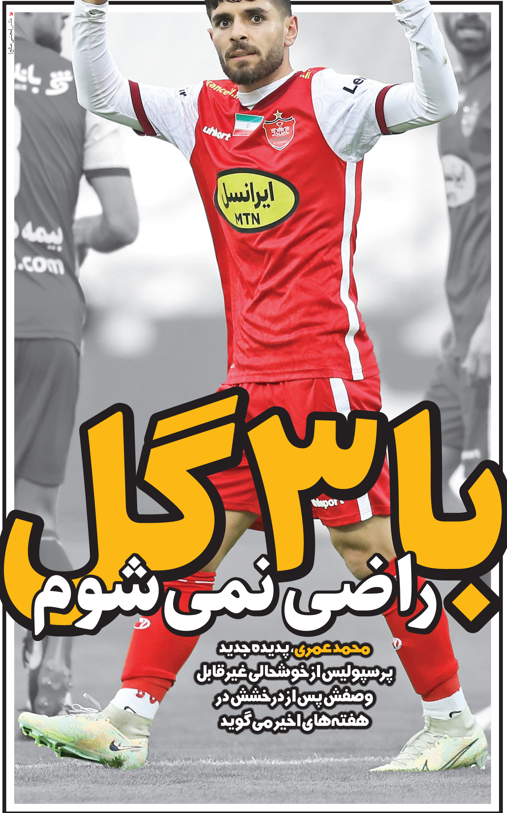
عکس: امجدی صالح