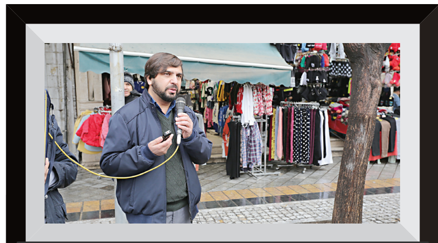
امروز اسلام جان فدا می خواهد و من آن جان فدا هستم

محلات عود لاجان و سنگلج از مناطق اعیان نشین تهران در دوره قاجار بوده و همپای بازار وفاداری بیشتری را به مذهب و روحانیت بروز می دادند. این را می توان از وجود ۱۶ مسجد و مدرسه در این کوچکترین محله تهران در یافت و اینکه طبق اسناد به جا مانده از دوره قاجار، بیشترین آمار روضه خوانی، زیارت نامه خوانی و