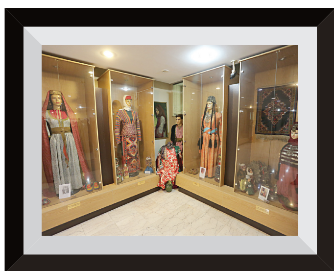
موزه لباس ادیان در کلیسای حضرت مریم

حضور در کلیسای حضرت مریم در خیابان سی تیر و تماشای موزه تاریخی اشیاء و لباس های مختلف ادیان از دیگر بخش های این سفر یک روزه بود. این موزه ۱۱ ساله است در دل کلیسای حضرت مریم راه اندازی شده است. تصاویر تعدادی از کلیساهای ایران و انجیل قدیمی ۲۰۶ ساله از بخش های دیدنی و جذاب این موزه تاریخی بود. در موزه مریم مقدس لباس های اقوام و ملیت ها در طول تاریخ به نمایش در آمده است. جالب اینکه ویژگی مشترک همه این لباس ها پوشیدگی لباس زنان در همه ادوار تاریخی بوده است.