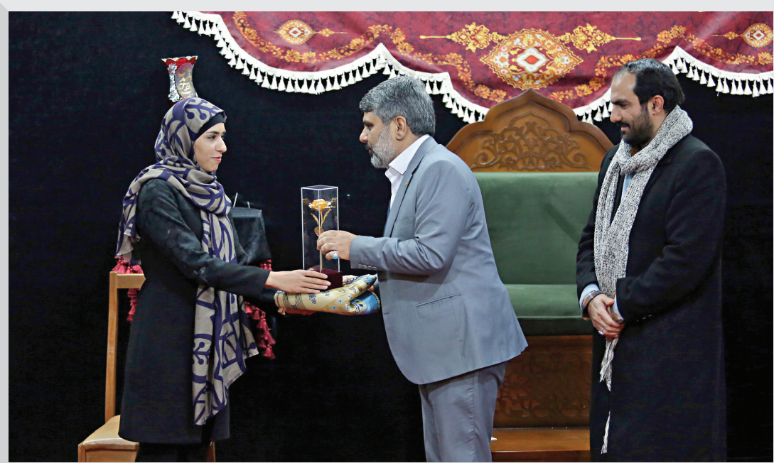
قدردانی از بانوی محجبه قهرمان

حضور در کلیسای حضرت مریم در خیابان سی تیر و تماشای موزه تاریخی اشیاء و لباس های مختلف ادیان از دیگر بخش های این سفر یک روزه بود. این موزه ۱۱ ساله است در دل کلیسای حضرت مریم راه اندازی شده است. تصاویر تعدادی از کلیساهای ایران و انجیل قدیمی ۲۰۶ ساله از بخش های دیدنی و جذاب این موزه تاریخی بود. در موزه مریم مقدس لباس های اقوام و ملیت ها در طول تاریخ به نمایش در آمده است. جالب اینکه ویژگی مشترک همه این لباس ها پوشیدگی لباس زنان در همه ادوار تاریخی بوده است.