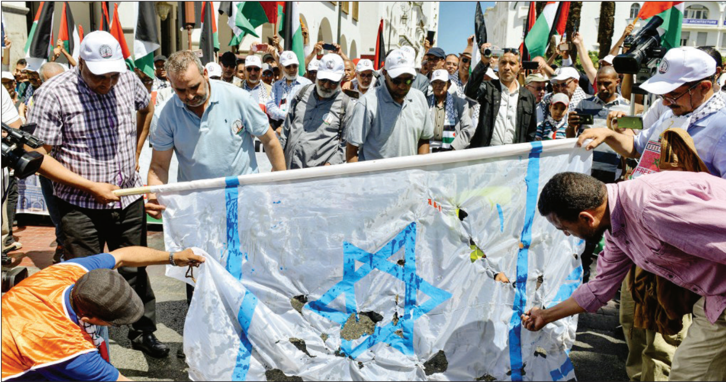
نقش‌رانی مراسم‌هایی به‌عنوان نماد برای روابط با اسرائیل محکم