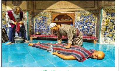
حمام علی قلی آقا شاهکار عصر صفوی

حمام علی قلی آقا که نام علی قلی آقا نیز شناخته می شود، از مناطق دیدنی اصفهان در منطقه بیدآباد است و در سال ۱۱۳۵، توسط علی قلی آقا در درباریان پادشاه صفوی، شاه سلیمان و شاه سلطان حسین صفوی ساخته شده است.