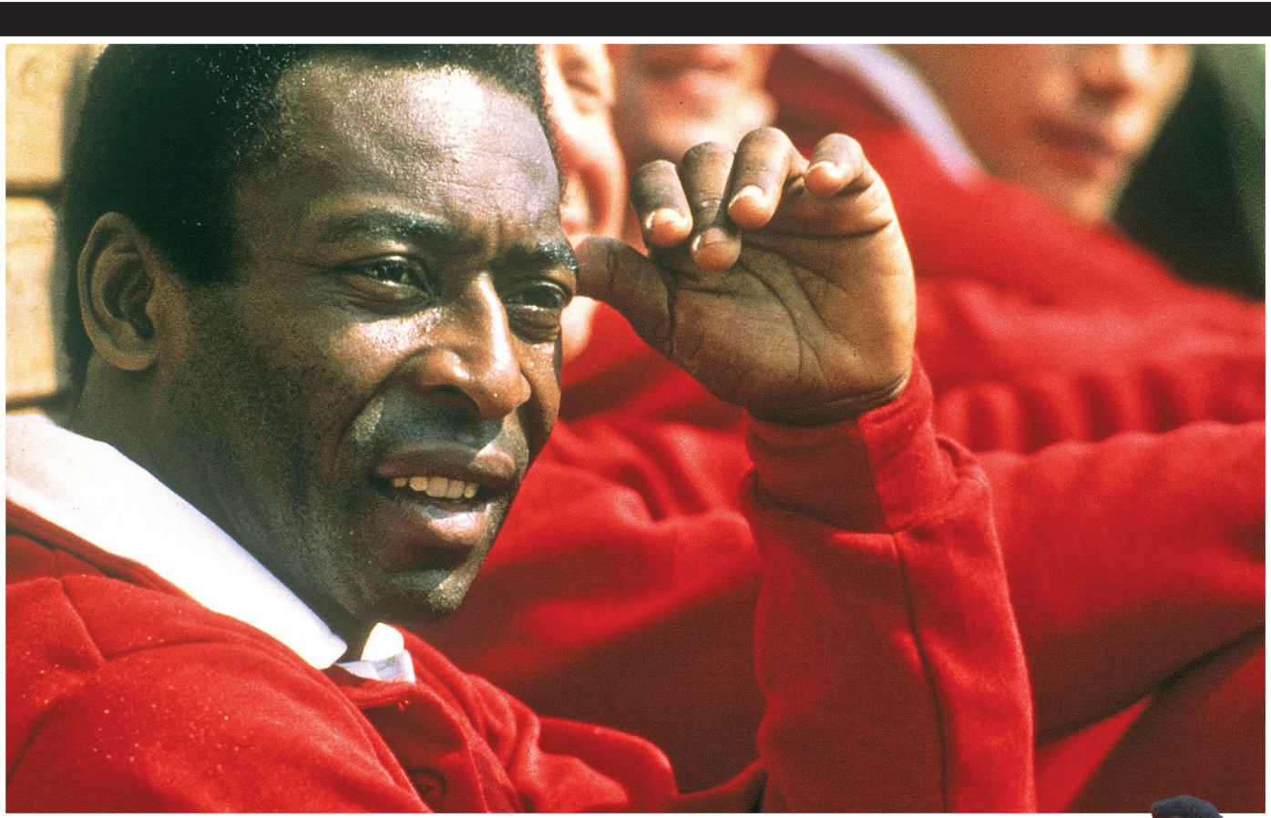
پله در حال بازی فوتبال در تیم ملی برزیل

نگاهی به نقش‌های «مروارید سیاه» بر پرده نقره‌ای