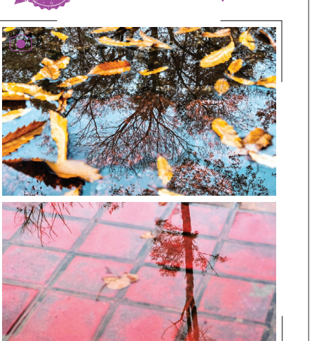
درختان در باران زمستانی رشت ریزش برگ درختان در فصل زمستان تصویری زیبا و متفاوت دارد. انعکاس درختان بی‌برگ روی بارانی که در گوشه و کنار شهر جمع شده، تماشایی است.