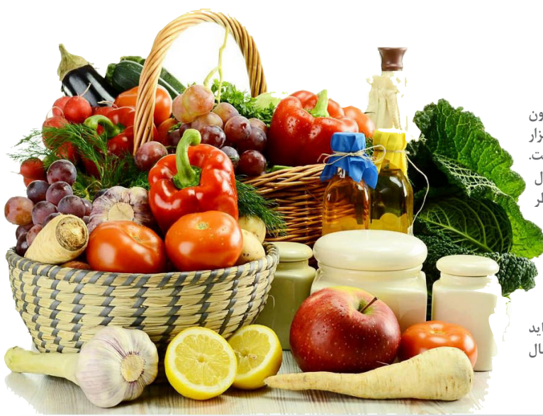
هزینه خوراک خانوارهای کارگری بر اساس سبد انستیتو تغذیه

شاخص تورم از بهمن ۱۴۰۰ که هزینه سبد معیشت خانوارهای کارگری به تصویب رسید تا پایان آذر امسال ۴۲ درصد رشد کرده است؛ اما در همین بازه زمانی به واسطه حذف ارز ترجیحی کالاهای اساسی، رشد شاخص تورم خوراکی‌ها ۵۸٫۶ درصد بوده و فشار زیادی به معیشت خانوارها وارد کرده است که البته فشار مازاد آن، از طریق افزایش رقم یارانه نقدی به ۴۰۰ هزار تومان جبران شد. به گزارش همشهری، بررسی‌ها نشان می‌دهد در نتیجه تورمی که در ماه‌های گذشته به اقتصاد تحمیل شده است، هزینه سبد غذایی انستیتو تغذیه برای خانوارهای کارگری به عنوان کارشناسی‌ترین ابزار برای تعیین سبد معیشت این خانوارها با رشد قابل توجه مواجه شده و از ۳ میلیون و ۵۵۵ هزار تومان در بهمن ۱۴۰۰ به ۵ میلیون و ۵۴ هزار تومان در انتهای آبان امسال افزایش پیدا کرده است. در بهمن سال قبل، سبد غذایی انستیتو تغذیه معادل ۳۹٫۶ درصد از کل هزینه معیشت کارگران مدنظر قرار گرفت و براساس آن رقم سبد معیشت ۸ میلیون و ۹۷۹ هزار تومان تعیین شد. اکنون نیز، با فرض همان ضریب ۳۹٫۶ درصدی سبد غذایی، رقم سبد معیشت کارگران در آخرین ماه پاییز به ۱۲ میلیون و ۷۶۴ هزار تومان می‌رسد که ۴۲ درصد بیش از سبد معیشت سال قبل است و باید برای جبران آن دستمزد‌ها را به مراتب بیش از سال قبل افزایش داد.