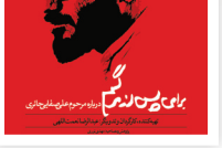
بی‌سرای بیس از مرگم

مورد غریب آقای عین صاد «سرای بیس از مرگم» کارگردان: عبدالضاعت‌اللهی