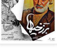
ع. عارف افشار

وضعیت سینمای دهه ۶۰ «برزخی‌ها»، کارگردان: عارف افشار