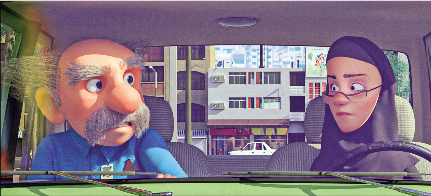
نمایش از فیلم «لوپتو»