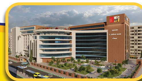
مجتمع چند منظوره میلاد