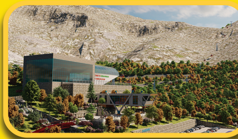
تله کابین طاقستان