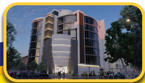
مجتمع چند منظوره ارغوان