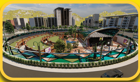
ایستگاه M8 قطار سبک شهری