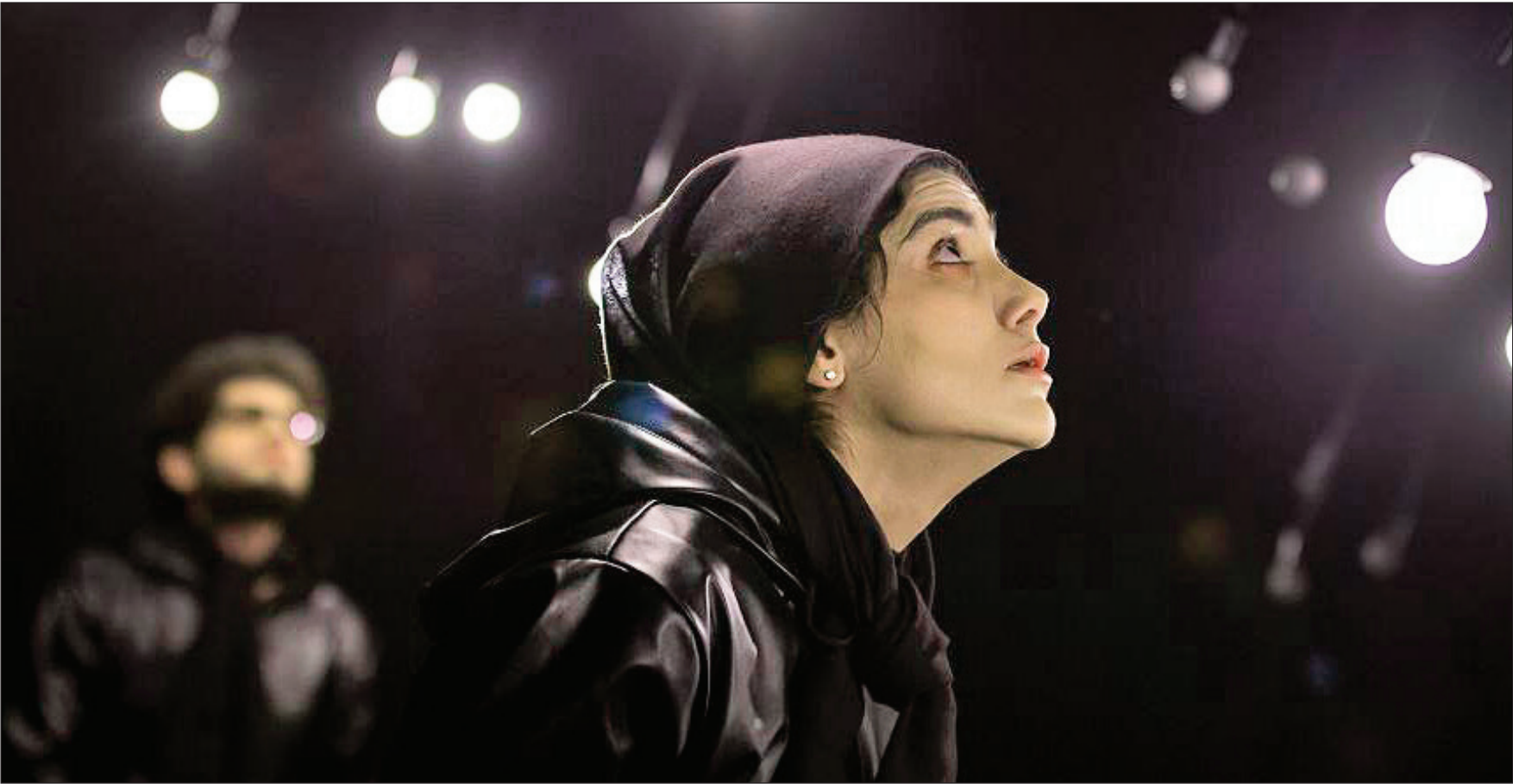
نمایش از نمایش مجلس شبیه‌خوانی قربان

گفت‌وگو با ۲ کارگردان شرکت‌کننده در جشنواره تئاتر مقاومت