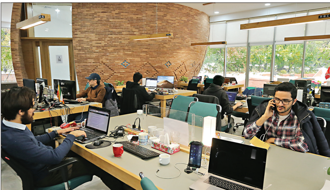
عکس همایشی باجمعیان سازد

مبلغ تسهیلات هر شرکت، معادل ۶ برابر مجموع هزینه های حقوق و دستمزد شرکت براساس لیست بیمه مهر ۱۴۰۱ اعلام شده است