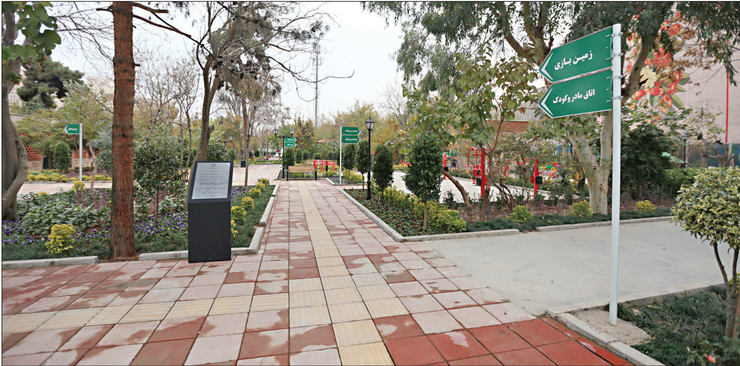
بوستان باغ نظری

بر اساس این برنامه، مناسب‌سازی ۲ بوستان شهید مصطفی خمینی و بوستان ۱۷ شهریور در دست اقدام است و با خاتمه عملیات اجرایی، بازسازی و مناسب‌سازی سربوس‌های بهداشتی بوستان تکمیل خواهد شد. همچنین اکنون بازسازی پیاده‌روی قدیمی معبر ۱۷ شهریور با هدف مناسب‌سازی با سرعت خوبی در حال پیشرفت بوده که این کار موجب رضایت ساکنان محله و مراجعان روزانه در این خیابان شده است. مناسب‌سازی پیاده‌روی خیابان فیاض‌بخش نیز هم‌اکنون در حال انجام است که نتیجه تقاضای چندین ساله معلولان برای دسترسی به ساختمان سازمان بهزیستی کشور در این خیابان است. انتظار می‌رود که با مناسب‌سازی این معبر، مسیر تردد بیشتر معلولان شهر در قلب تهران هموارتر شده و رضایت خاطر آنان را فراهم آورد. همچنین به‌سازی و مناسب‌سازی معبر ظهیرالاسلام تا پایان سال انجام می‌شود. این خیابان بزرگ‌ترین کتابخانه نابینایان کشور را در دل خود جای داده و محل تردد روزانه جمع زیادی از نابینایان شهر است. علاوه بر موارد فوق، مناسب‌سازی میدان‌های شوش و بهارستان هم در حال انجام است که ان‌شاءالله به‌زودی در اختیار این شهروندان قرار خواهد گرفت.