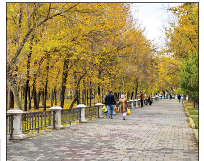
طبیعت پاییزی سقز

این روزها با آمدن فصل پاییز و هوای بارانی آن، طبیعت رنگ درختان در پارک‌های شهر سقز در استان کردستان، حال و هوای خاصی دارد و گویا نقاش چیره دست تابلویی زیبا و دل‌انگیز به تصویر کشیده‌است. پارک‌های زیبا و سرسبز سقز که از جاذبه‌های دیدنی این شهرستان به شمار می‌روند، چند روزی است با بارش رحمت الهی رنگ و بوی خاصی به‌خود گرفته‌اند.