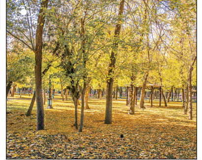
طبیعت پاییزی سقز