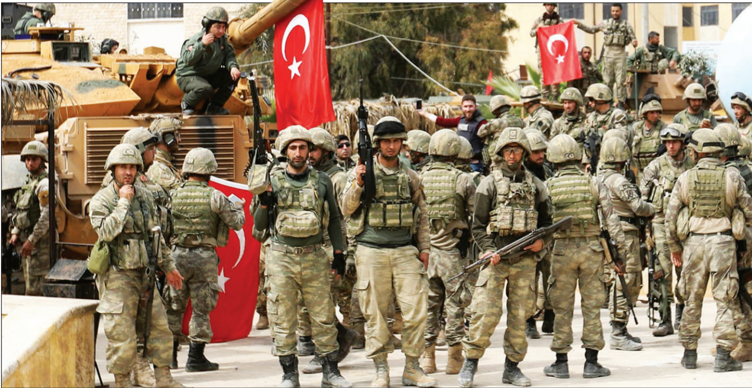
نیروهای ترکیه در حمله به سوریه، سال ۲۰۱۸