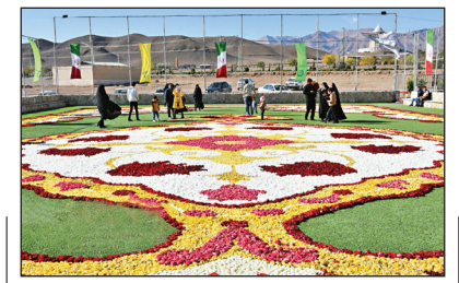
بزرگ‌ترین فرش سرگل خاورمیانه در محلات

پنجمین فرش سرگل خاورمیانه با ابعاد ۸۰۰ مترمربع با تعداد ۲۰۰ هزار سرگل تا فردا ۳۰ آبان برای بازدید علاقه‌مندان در زمین چمن کوی امام رضا(ع) محلات به‌مایش گذاشته شده است.