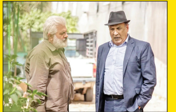
مدیر گروه سریال شبکه ۲ می گوید: «دستمزد بگیران میلیاردی درباره تلویزیون صحبت نکنند.»