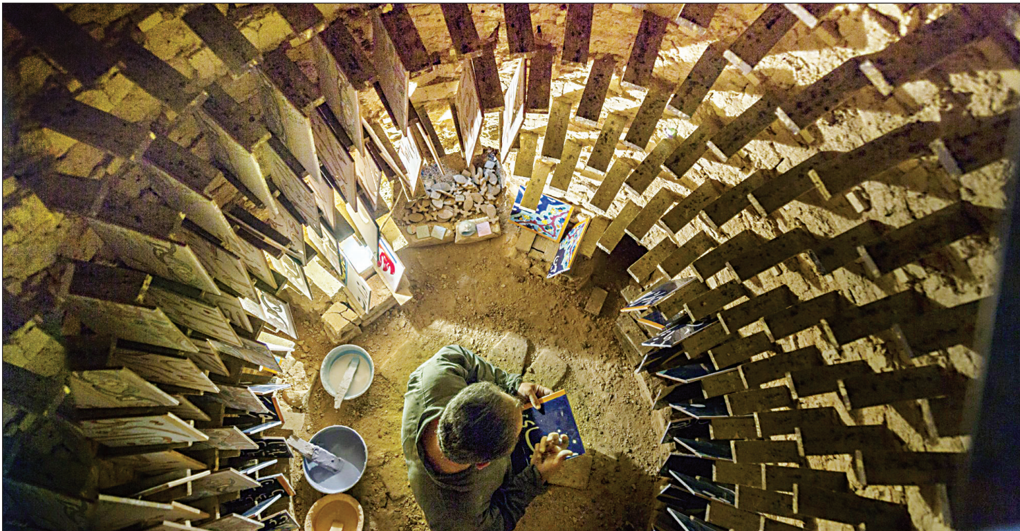
کارگاه کاشی هفت رنگ در شیراز

۸۰ کارگاه صنایع دستی برای تولید و احیای ۸۰ هنر صنعت زنده در محله های شیراز؛ شهر جهانی صنایع دستی راه اندازی می شود