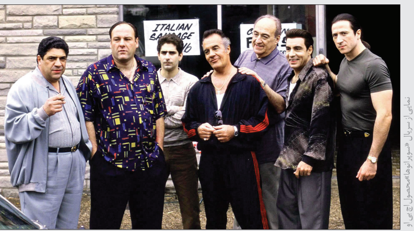
مشاهیر از سریال سوپرزویا (تولید اچ‌بی‌وی)

اما شرایط خیلی زود تغییر کرد. به‌عنوان یکی از نخستین تلویزیون‌های بولی، اچ‌بی‌وی فقط باید صبر می‌کرد تا قوانین حمایتی و فشار دیگر شرکت‌های مشابه، نفوذ شبکه‌های کابلی را در آمریکا بیشتر کند. استفاده‌کنندگان از تلویزیون‌ها کابلی، از ۵۰ هزار در سال ۱۹۷۴ میلادی، در سال ۱۹۷۸ به ۱۵ میلیون نفر رسید. تا سال ۱۹۷۷، اچ‌بی‌وی دیگر حسابی به سود رسیده بود و آینده شرکت هم مطمئن به‌نظر می‌رسید. در سال ۱۹۷۵، اچ‌بی‌وی نخستین برنامه مخصوص کم‌دی خود به نام «یک شنب با رابرت کلاین»، را پخش کرد. این برنامه مخصوص، در کنار یک جنگ کم‌دی به نام «در موقعیت»، زمینه را برای تبدیل شدن اچ‌بی‌وی به یکی از کم‌دی‌سازان مطرح آمریکا مهیا کرد. اچ‌بی‌وی همچنان بزرگ و بزرگ‌تر شد و در سال ۱۹۸۳، تصمیم گرفته شد که این شبکه، برنامه‌های خودش را تولید کند. کنار ساخت فیلم‌های اورجینال ساخته شده برای این شبکه کابلی، و هم‌نیطور مینی‌سریال‌هایی که هزینه ساخت آنها بسیار فراتر از سریال‌های تلویزیون آن زمان بود، شروع شد. پخش «نه ضرورتاً خبر» که یک سئوی خبیری طنز بود در سال ۱۹۸۳ شروع شد؛ این برنامه، در واقع از نظر ساختار و فرم، پدر بزرگ برنامه بر طرفدار «هفته پیش همین شب با جان الیور» به‌شمار می‌رود. اولین فیلمی که خود شبکه تهیه تهیه‌کننده آن بود، «داستان فاکس رویاه» بود. فیلم در همان سال ۱۹۸۳ پخش شد. این فیلم نخستین فیلم تاریخ بود که فقط برای شبکه‌های کابلی تولید می‌شد. همه چیز برای اینکه اچ‌بی‌وی به یکی از غول‌های گزگذار تاریخ نمایش تبدیل شود مهیا بود.