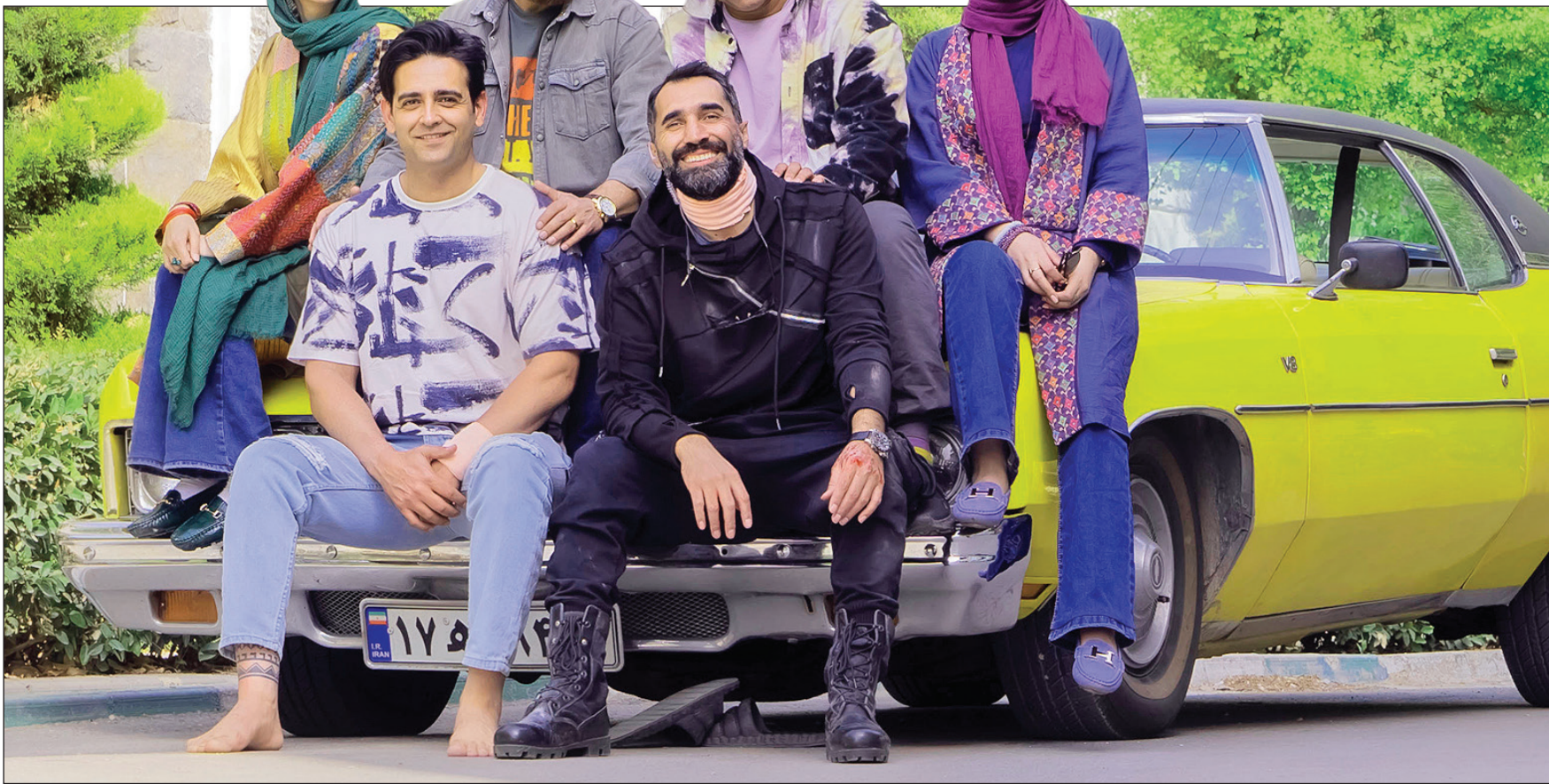
نمایی از فیلم «بخارست» (تکلی احترام اطیبی)

نمایش عمومی «بخارست» کمدی‌ای که قرار بود برای رونق بخشیدن سینماها روی پرده بیاید به تعویق افتاد