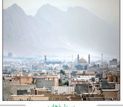
سرپل ذهاب ۵سال بعد از زلزله

ساعت ۲۱:۴۸، ۲۱آبان ۱۳۹۶ زمین‌لرزه‌ای به قدرت ۷٫۳ریشتر غرب استان کرمانشاه را لرزاند؛ ۶۲۰نفر کشته و ۱۲هزار نفر مصدوم شدند. اکنون پس از ۵سال از این رخداد تلخ، شهر «سرپل ذهاب» که بیشترین میزان کشته و تخریب را داشت، دوباره احیا شده و زندگی و کسب‌وکارها به روال سابق بازگشته است.