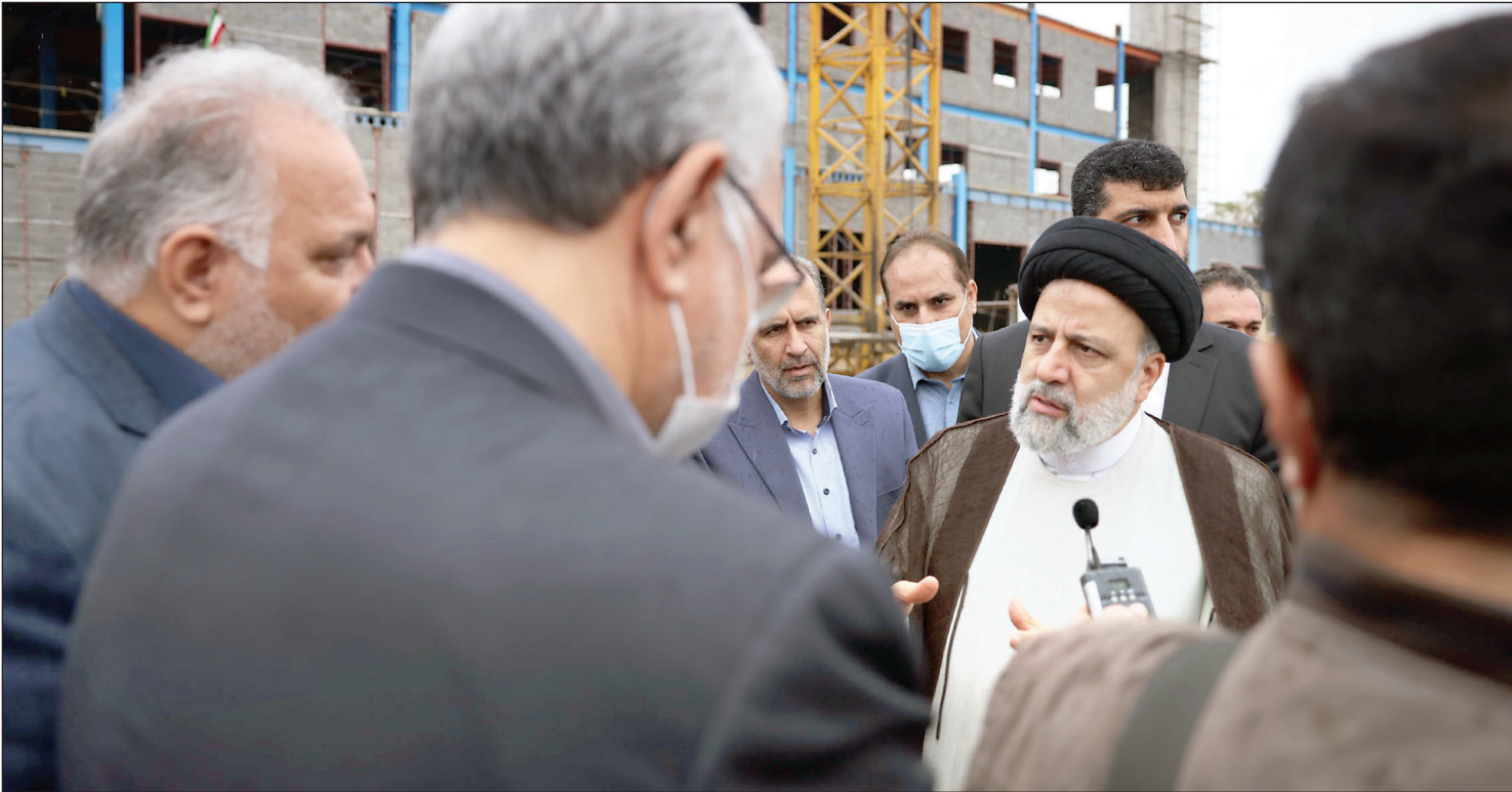
رئیس‌در محل بیمارستان شهید کاو در ترمیم پاکدشت، پایگاه اطلاع‌رسانی ریاست‌جمهوری