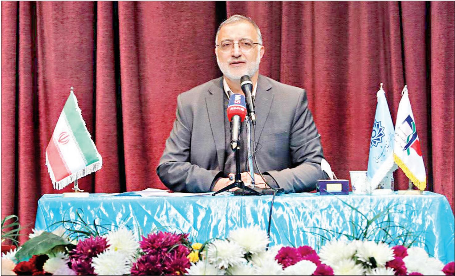
شهردار تهران با دانشجویان دانشگاه تربیت معلم گفتگو می‌کند