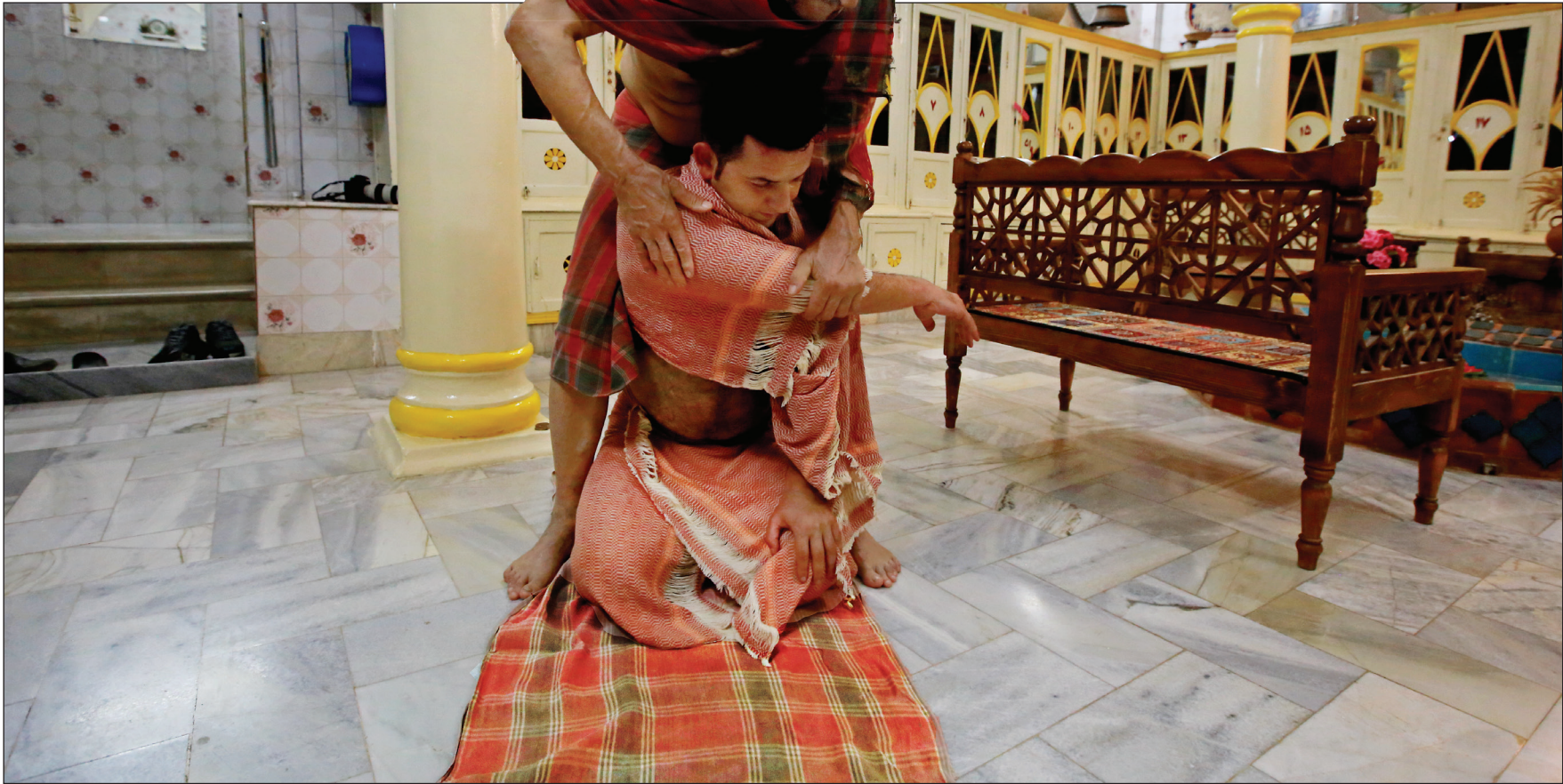
عکس همسرانی خلد خورشیدی