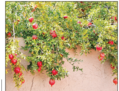
برداشت انار از باغ‌های شهرضا

هر سال برداشت انار از یازدهم مهر آغاز می‌شود و تا پایان آبان ادامه دارد. در فصل برداشت انار شهرضا گردشگرانی از نقاط مختلف با حضور در بازارچه‌های محلی به خرید انار می‌پردازند. در شهرضا ۱۸۰۰هکتار باغ انار وجود دارد و بیش‌بینی می‌شود ۱۷هزار تن انار از انارستان‌های شهرضا برداشت شود.