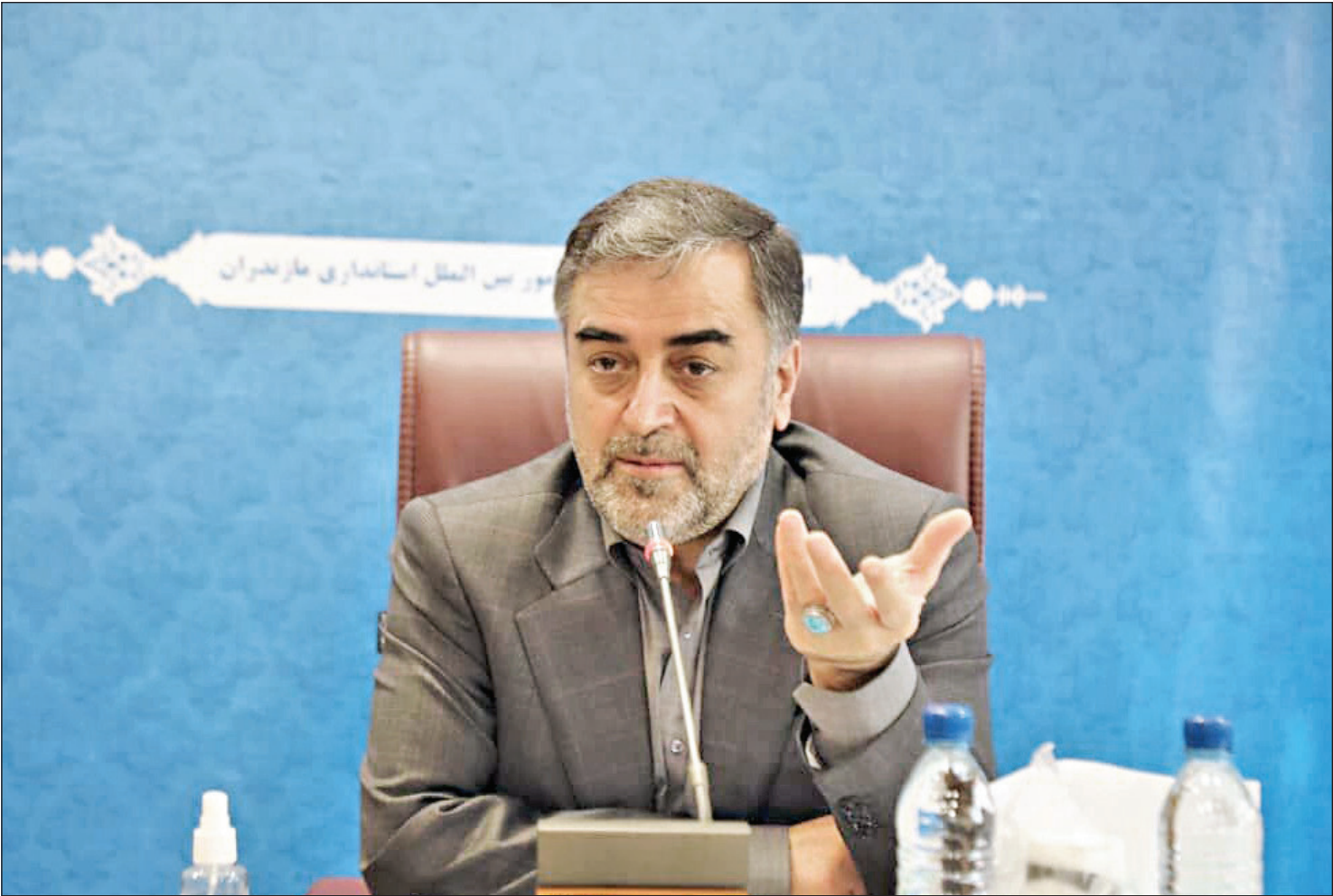
استاندار مازندران در گفت‌وگو با همشهری مطرح کرد:

وی درباره آخرین اقدامات وزارت جهادکشاورزی در حوزه کشت گیاهان دارویی نیز توضیح می‌دهد: مهم‌ترین کاری که انجام داده‌ایم، این است که تولید و خودکفایی در زمینه برخی از گیاهان دارویی را رقم زده‌ایم. به‌عبارت دیگر هم‌اکنون در مورد تولید برخی از گیاهان دارویی از جمله زعفران، در سطح دنیا رتبه اول را داریم.