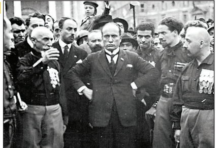
موسولینی در جمع سیاهپوشان فاشیست

فاشیسم از کلمه لاتین «فاشس» (Fascio) گرفته شده که به معنی تیر است. از آنجایی که تیر نزد فرمانروایان رم به‌عنوان نماد قدرت شناخته می‌شد موسولینی نام حزب خود را حزب ملی فاشیست گذاشت و تیر را به‌عنوان نماد آن انتخاب کرد. در عمل هدف جنبش سیاسی فاشیسم برقراری نظام ضد پارلمانی بود؛ نظامی که ایده‌های بنیادینش ناسیونالیسم افراطی و دشمنی آشکار با لیبرالیسم و کمونیسم بود.