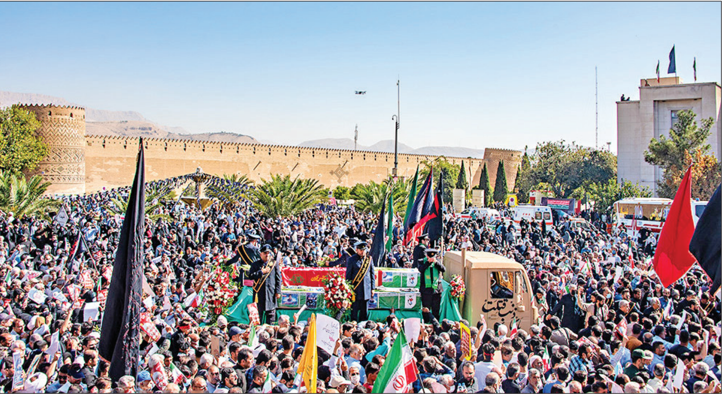
عکس از تشریح شیراز برای سوزان

خروش یکپارچه مردم علیه اغتشاشگران در تشییع شهدای شاهچراغ