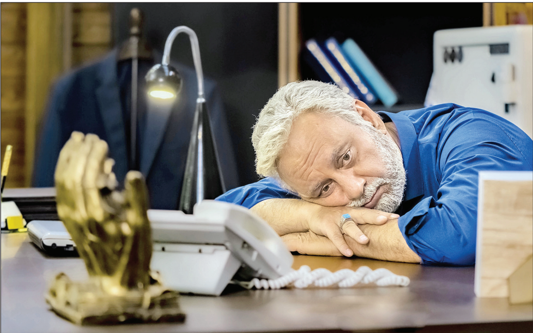
نمایی از فیلم بخارست، آخرین ساخته مسعود اطیابی که بسیاری امیدوارند مانند فیلم‌های قبلی این کارگردان بفروشد؛ عکس: سید حسام‌الدین اطیابی

سینمای ایران، بدون در نظر گرفتن خواست مخاطب و حذف اکران عمومی چه مسیری را طی می‌کند؟