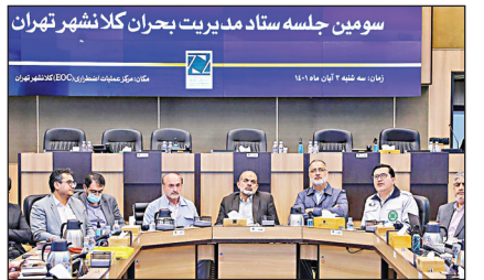
سومین جلسه ستاد مدیریت بحران کلاشهر تهران

در ادامه این جلسه، شهردار تهران درباره موضوع سیل گفت: «در موضوع سیل بخشی از آن به آبخیزداری و بخشی به درون شهر تهران بر می‌گردد؛ تهران ۵۳۰ کیلومتر شبکه جمع‌آوری آب‌های سطحی دارد که کافی نیست و بازسازی شبکه جمع‌آوری آب‌های سطحی موجود و ایجاد شبکه‌های جدید باید انجام شود.» به گفته علیرضا زاکانی، طبق برنامه طراحی شده قرار بود این شبکه تا سال ۱۴۲۰ تکمیل شود اما با تلاش و برنامه‌ریزی انجام شده تا سال ۱۴۰۶ این شبکه تکمیل خواهد شد.