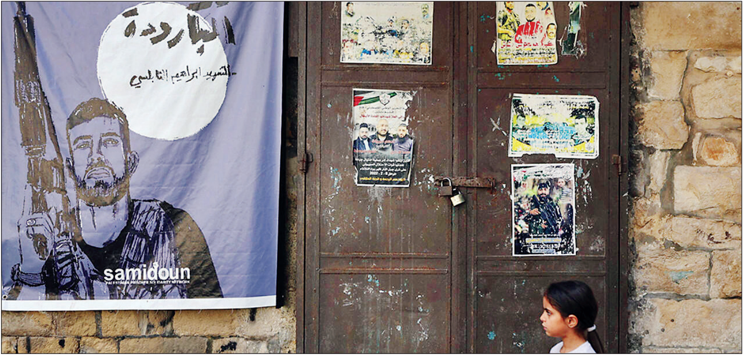
تصویر از المانی‌تور، فرموده شهید جوان‌های ال‌امی. عکس: AFP

افزایش فشارهای رژیم صهیونیستی به ساکنان کرانه باختری و واکنش جوانان فلسطینی با عملیات‌های مسلحانه گمانه‌زنی‌ها درباره شکل‌گیری انتفاضه سوم را افزایش داده است