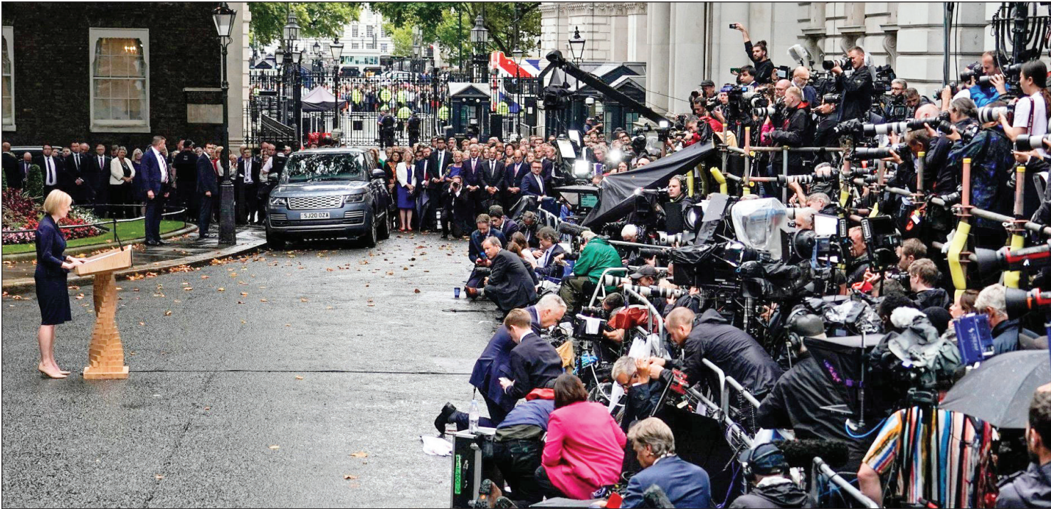
انعام استغفای لیز تراس در مقابل خبرتخت‌وزیری عین