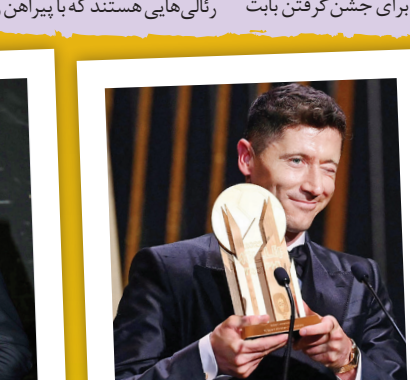
لواندوفسکی برای دومین سال پیاپی جایزه گلدن بول را که به بهترین مهاجم سال تعلق می‌گیرد، برد. او ۵۹ گل برای دریافت این جایزه به نمر رساند.