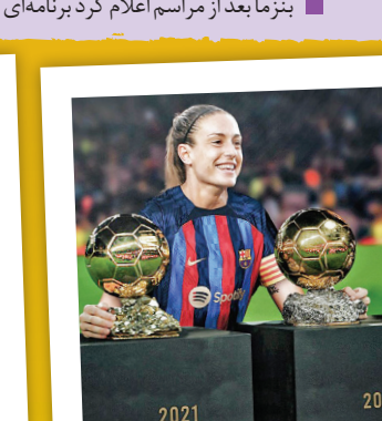
پوتیاس ۲۸ ساله از بارسا در حالی برای دومین بار توپ طلای زنان را از آن خود کرد که در رقابت‌های فصل ۲۲-۲۰۲۱ با پیراهن بارسلونا ۲۸ گل به نمر رساند.