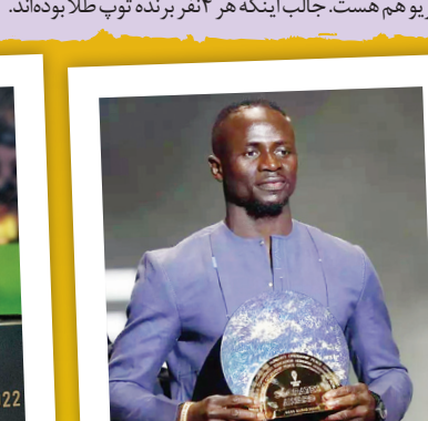
نخستین جایزه سوکراتس که برای فوتبالیستی که در فعالیت‌های اجتماعی و بشردوستانه نیز مشارکت داشته، به سادو مانه رسید.