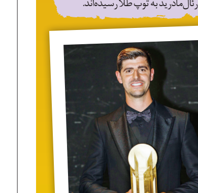
کورتوا ۳۰ ساله پس از گذراندن فصلی رویایی به همراه رئال مادرید و ثبت ۱۷ گلین شبت در ۵۳ بازی برنده جایزه بهترین دروازه‌بان شد.