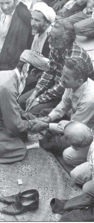
نمایی از فیلم «ساز دوست دانشی» از فیلم‌های جشنواره فیلم کودکان اسل

این‌خبر توسط محمدحسین دانایی، خواهرزاده زنده‌یاد جلال آل احمد، به رسانه‌ها اعلام شد.