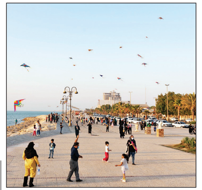
ساحل بادبادک‌ها در بوشهر به مناسبت روز جهانی کودک روز گذشته (یکشنبه ۱۷ مهر) مسابقات بادبادک‌بازی و رنگ‌آمیزی کودکان در سواحل بندر بوشهر برگزار شد.