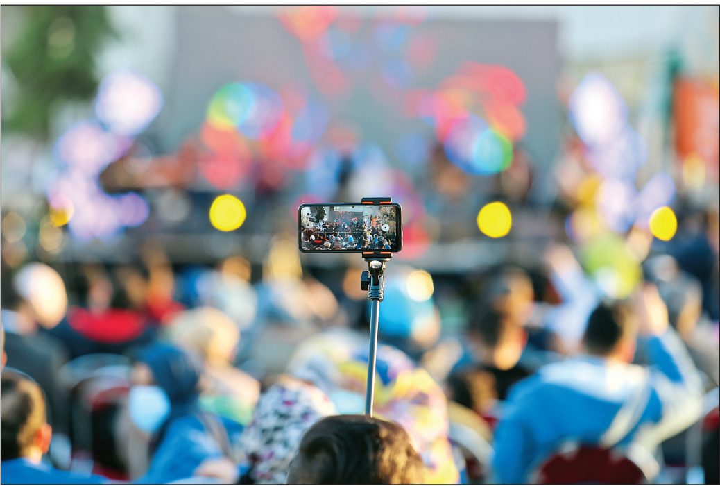
تولید محتوا در فضای مجازی