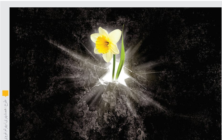
فرج و ظهور امام زمان (عج)

برای ظهور حضرت ولی عصر (عج) باید دعا کرد و یاور او شد. باید به‌سویش دست دراز کرد و یار او شد