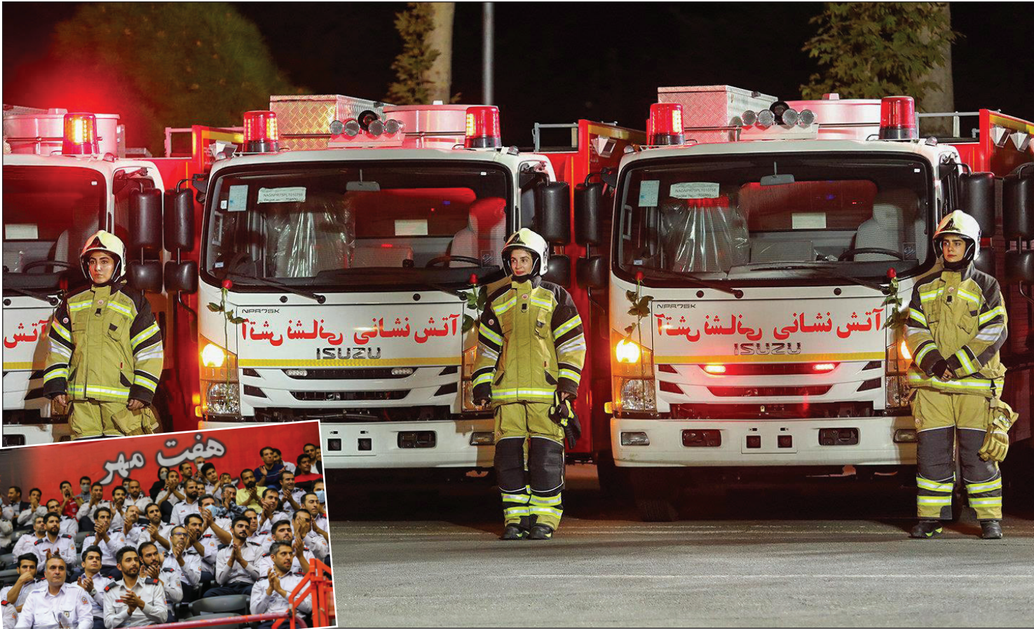
همزمان با مراسم گرامیداشت روز ایمنی و آتش‌نشان و در حضور رئیس‌جمهور و شهردار تهران صورت گرفت