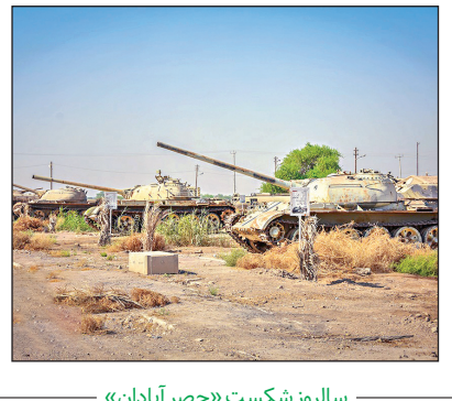
سالروز شکست «حصار آبادان»

آبادان از شهرهای مهم خوزستان و به شکل مثلی است که قاعده آن به طرف خلیج فارس و رأس آن به سمت خرمشهر است. اوایل تجاوز رژیم بعثی عراق این شهر به‌صورت نمایی شکل به محاصره آنها درآمد. این شهر در ساعت یک بامداد ۵ مهر ۱۳۶۰ با رمز مقدس «نصر من الله و فتح قریب» طی نخستین عملیات گسترده در مقابل ارتش متجاوز عراق با موفقیت کامل پس از یک سال از محاصره دشمن بعثی از حصر خارج شد.