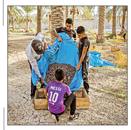
برداشت خرما در خوزستان

اواخر شهریور هرسال موعد برداشت خرما از ۳۳ هزار هکتار از نخلستان‌های خوزستان است. این استان دومین تولیدکننده خرما در کشور است که پیش‌بینی می‌شود امسال در ۱۷ شهر آن بیش از ۱۸۷ هزار تن خرما برداشت شود. خرما تولیدی در نخلستان‌های خوزستان به کشورهای مختلف آسیا و اروپا صادر می‌شود. منبع: ایرنا